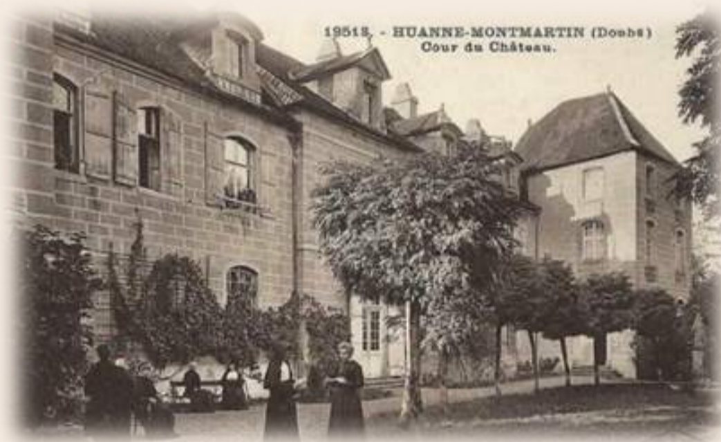
Publicité pour l'école